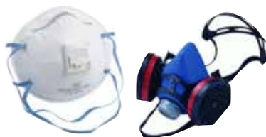
Masques respiratoires et bavettes