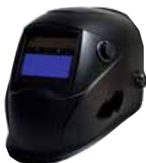
Masques anti-UV et anti-IR